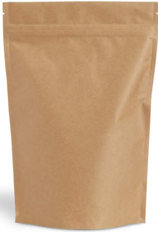
1. Ruskealla paperilla päällystetty pakkaus 250g.

Kaikissa pakkauksissa on kätevä pussinsulkija sekä venttiili takapuolella. Kaikki pakkaukset voi kierrättää muovikierrätyksessä.