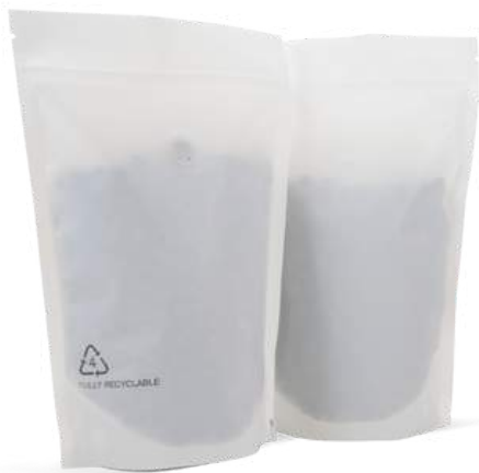
3. Valkoinen muovipakkaus 250g.