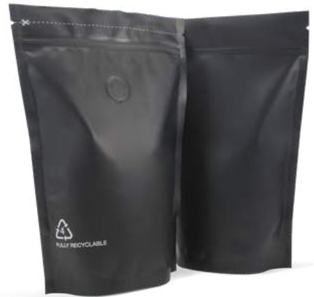
2. Musta muovipakkaus 250g.